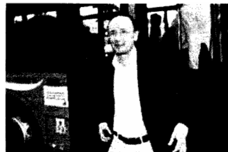
L'assessore regionale ai Trasporti, Guglielmo Minervini. In occasione della presentazione di nuovi voli per Bari ha annunciato ieri i lavori di allungamento della pista del «Gino Lisa» di altri 300 metri, vecchia aspirazione della città